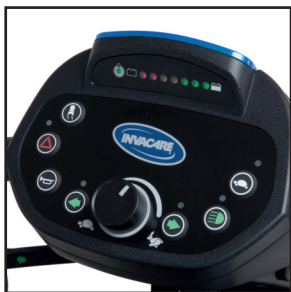
Tableau de bord LCD intuitif Pegasus METRO

Conçu pour être utilisé facilement et avec précision, doté de boutons surélevés, de lumières DEL, de signaux sonores et d'un indicateur de batterie lumineux affichant le pourcentage de batterie restante.