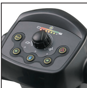
Tableau de bord « intuitif »

Les lumières des freins arrière s'allument au relâchement de l'accélérateur. Les indicateurs de direction gauche et droit arrêtent automatiquement de clignoter après 30 secondes.