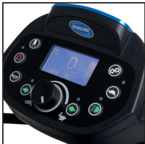
Tableau de bord LCD Pegasus PRO , Comet PRO , Comet ULTRA

Conçu pour être utilisé facilement et avec précision, doté de boutons surélevés, de lumières DEL, de signaux sonores et d'un indicateur de batterie lumineux affichant le pourcentage de batterie restante.